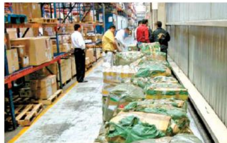
La mercancía que no es reclamada pasa a ser propiedad del fisco federal.

En los almacenes del aeropuerto se puede encontrar de todo; desde ropa y medicinas hasta aviones.